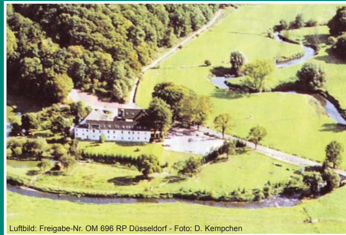
Luftbild: Freigabe-Nr. OM 696 RP Düsseldorf

Navigationsgerätehinweis: Würselen - Mühlenweg